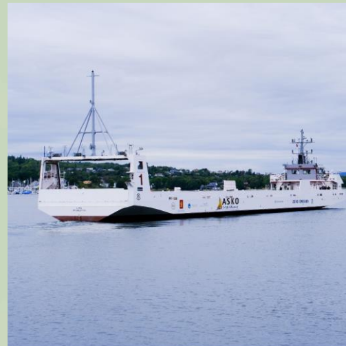
ASKOs autonome sjødrone ankommet Norge!