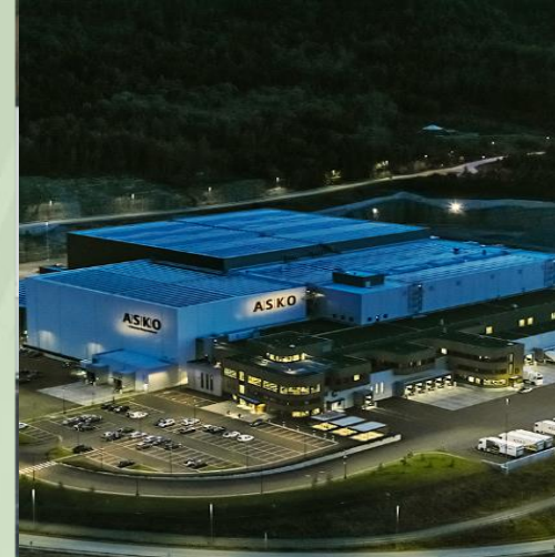
Nordens mest miljøvennlige industribygg