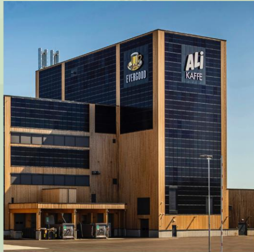
Norges miljøvennlige kaffebrenneri